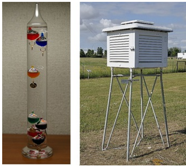
Figure 3. A gauche, thermomètre de Galilée [source : By Hustvedt (Own work) [CC BY-SA 3.0 ( http://creativecommons.org/licenses/by-sa/3.0 ) via Wikimedia Commons]. A droite, abri météorologique pour mesurer la température de l'air.

Nous savons tous ressentir qu'un milieu est plus ou moins chaud, d'où la notion intuitive de température . C'est cependant l'une des grandeurs physiques les plus difficiles à définir et à mesurer. Il est reconnu depuis la fin du 19 e siècle que la température représente l'énergie d'agitation des particules élémentaires du milieu considéré, atomes ou molécules. En pratique la température d'un milieu est repérée par un thermomètre, dont les versions les plus traditionnelles utilisent la dilatation d'un liquide. C'est sur ce principe que fonctionne le thermomètre inventé par Galilée en 1602 (Figure 3), ainsi que les thermomètres à liquide (alcool ou mercure) inventés ultérieurement. Le physicien Daniel Gabriel Fahrenheit proposa en 1724 une échelle de température encore utilisée aux USA : le zéro correspond à la température la plus basse qu'il ait observée dans sa ville de Danzig (Gdansk), et 100 °F à une température haute mesurée dans le cul d'un cheval. Le suédois Anders Celsius introduisit plutôt la glace fondante et l'eau en ébullition pour définir les températures 0°C et 100°C, graduant uniformément le thermomètre entre ces deux repères [4]. A ce stade il s'agit d'une échelle de température, plutôt qu'une mesure , car l'addition de température n'a pas de sens, de même que la multiplication par un facteur.