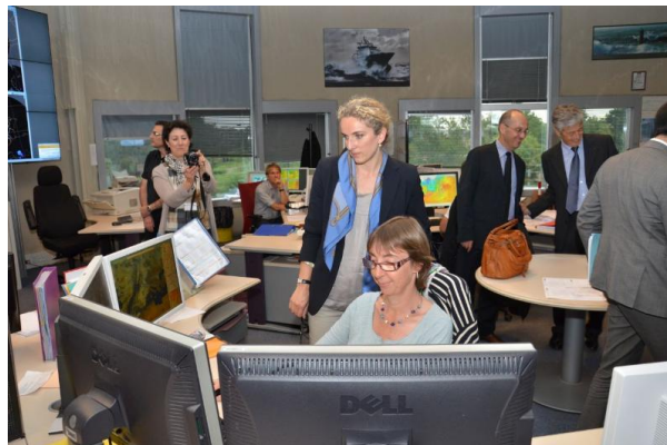
Figure 1. Visite de Madame Delphine Batho, Ministre de l'Ecologie, du Développement durable et de l'Energie, au Centre National de Prévision (CNP) de Météo France à Toulouse en 2013.

Sans dresser un historique, on peut situer aux années 1970/1980 le recours systématique aux modèles de PNT pour réaliser des prévisions. C'est en effet à partir de cette période que la prévision numérique commence à donner des informations pertinentes sur l'anticipation possible de l'occurrence de tempêtes aux latitudes moyennes. La prévision de ces phénomènes, qui peuvent occasionner des dommages considérables aux personnes et aux biens, constitue en Europe, encore aujourd'hui, une préoccupation majeure. Des tempêtes marquantes sont à l'origine de la création en France d'un service météorologique international [1] au sein de l'Observatoire de Paris en 1856 et de la mise en place du dispositif de vigilance météorologique [2] en 2001.