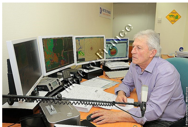
Figure 4. Joël Collado, prévisionniste de Météo France, une voix emblématique sur les ondes de Radio France de 1994 à 2015.

spécialement formés. Ils effectuent des prestations sur mesure parfois en se déplaçant sur le lieu de l'activité pour être au plus près de l'utilisateur. Ils peuvent utiliser des moyens d'observations dédiés, comme les radars météorologiques mobiles, qui permettent d'améliorer sensiblement l'anticipation de l'occurrence de précipitations sur le lieu de l'événement.