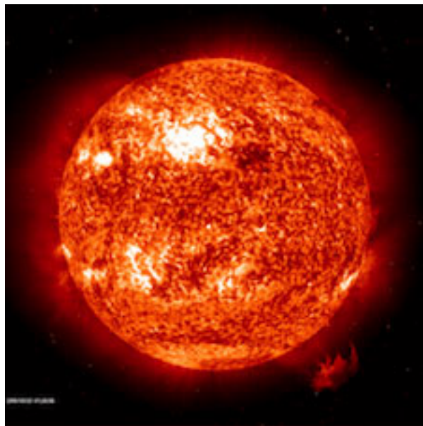
Figure 3. Photographie d'une éruption solaire à 304 nm. A cette longueur d'onde, on observe plus facilement la dynamique de la surface du soleil que dans la gamme large du visible, qui donne l'aspect lissé de la figure 1. Ici, les zones sont plus froides et les zones brillantes sont plus chaudes.

Chacun sait que l'eau qui bout projette des gouttelettes au-dessus de la surface. Il en va de même à la surface du soleil. Cependant, en raison de la nature de la matière solaire, l'origine de cette éjection diffère quelque peu de celle de l'eau bouillante, et est fortement marquée par la présence du champ magnétique. De surcroît, la matière éjectée, elle-même ionisée, est capable d'emporter avec elle ce champ magnétique avec une telle efficacité que ce champ est souvent dit « gelé dans la matière ». C'est ce que l'on appelle le « vent solaire » ou le « champ magnétique interplanétaire », selon les aspects auxquels on s'intéresse.