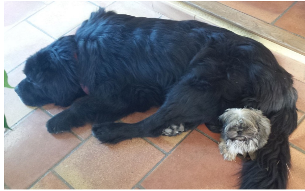
Figure 2. La variété des races de chiens illustre bien l'ampleur de la variabilité héréditaire fortuite. En l'utilisant l'homme a pu, à partir du loup, obtenir des lignées aussi différentes qu'un Terre-neuve et un Shih-tzu.

Les deux piliers de la théorie, variabilité héréditaire fortuite et sélection naturelle, sont souvent très mal compris.