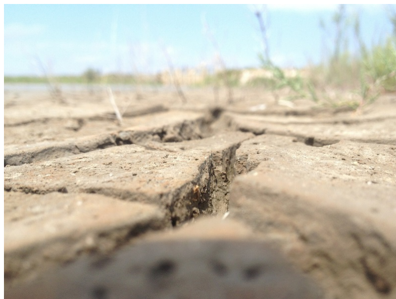
Figure 5. Formation de terres arides, voire désertiques et raréfaction de la couverture végétale.

environnementales délétères , mais si la population de la planète ne cesse d'augmenter, ne faut-il pas tenter de la nourrir, et ce de la façon la moins néfaste possible ? Le dessalement de l'eau de mer a un coût de l'ordre de 0,7 €/m 3 , et une consommation électrique de 2 à 4 kWh/m 3 : c'est environ dix fois trop pour de l'eau d'irrigation, mais acceptable pour l'eau domestique.