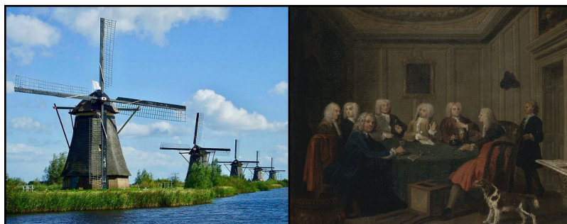
Figure 1. Polder néerlandais et club de gentlemen anglais, Joseph Highmore 1730 [Source : Figure de gauche, By Lidia125 [Public domain], from Wikimedia Commons ; Figure de droite, Joseph Highmore [Public domain], via Wikimedia Commons]

L'autre catégorie de biens publics impurs correspond aux biens communs ( common pool resources ), étudiés par Vincent et Elinor Ostrom [2] ; ils correspondent aux situations où il y a rivalité mais guère d'exclusion possible. Leur exploitation partagée est vieille comme le monde. Les travaux d'économie institutionnelle, de droit et de politiques publiques ont montré qu'une gestion durable de ces biens, surtout à l'échelle locale, ne nécessite de recourir ni au marché ni à l'État, mais passe par la mise en place d'une institution de gestion communautaire (Ostrom, 1990). Son principe de fonctionnement est l'équité : une communauté réunit des êtres différents pour agir en commun sur la base de contraintes adoptées en commun, notamment en ce qui concerne les charges.