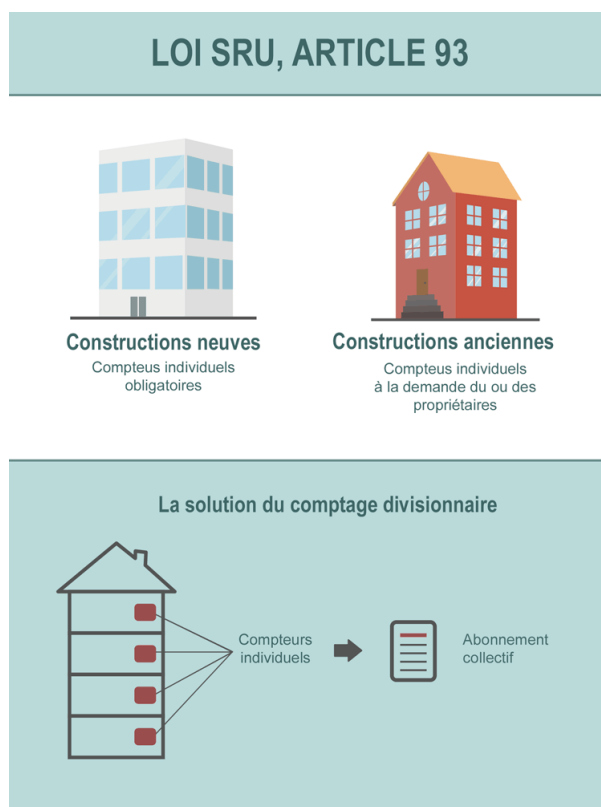
Figure 5 : Dans la loi SRU (Solidarité et renouvellement urbain) de 2000, l'article 93 prévoit l'obligation pour le service public d'eau d'installer des compteurs individuels et d'envoyer des factures à chaque ménage vivant dans le même immeuble, mais seulement à la demande du ou des propriétaires ; le comptage de l'eau par appartement est obligatoire dans les constructions neuves, mais pas dans les anciennes, où les appartements sont souvent desservis par deux ou trois colonnes d'eau ! Et on peut individualiser les compteurs et garder un abonnement collectif : c'est la solution du comptage divisionnaire.

Or, d'après nos propres investigations [9] même avec les compteurs divisionnaires, un moyen « plus juste » de répartir la facture de l'immeuble, les contestations n'ont pas disparu ; avant le développement de la télé-relève, il y avait toujours des occupants qui n'étaient pas là au moment du relevé de compteurs situés dans leurs appartements. Et il y a toujours des compteurs qui dysfonctionnent. Avec la télé-relève, on découvre que certains résidents refusent d'être « surveillés » dans leur vie privée par le biais du comptage en temps réel.