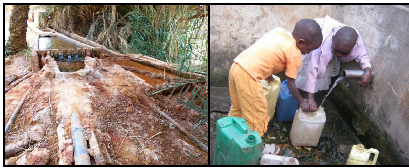
Figure 3. Avant les compteurs : répartition traditionnelle de l'eau en bien commun (Foggara en Algérie à gauche) et achat de l'eau 'au bidon' (à droite).

Il est probable qu'on a d'abord imaginé apporter l'eau près du domicile par une fontaine d'eau courante, par exemple dans les cours d'immeuble, et cela par mimétisme de l'approvisionnement public de l'époque. L'eau coulait en permanence, donc pourquoi la compter ? Ce rapport à l'eau est resté dominant dans la culture des pays du Common-wealth . En Angleterre, malgré une prévision de généralisation des compteurs en 2000, faite lors de la privatisation des services d'eau en 1989, un peu plus de la moitié des ménages n'ont toujours pas de compteurs, et payent l'eau via des impôts locaux liés à la valeur locative de leur logement, les rates . Évidemment, les charges de l'assainissement sont également payées sous cette forme. Ce système d'accès à l'eau sans compteur est encore plus répandu en Irlande et au Canada, où, il est vrai, l'eau est abondante.