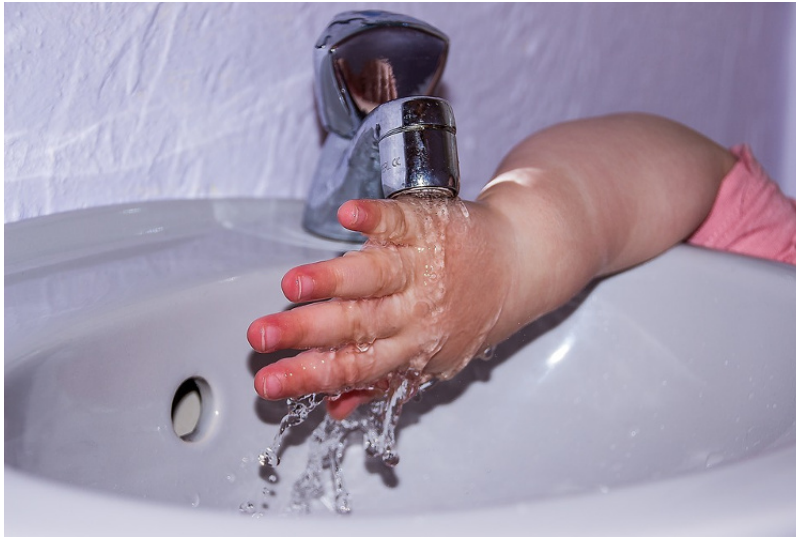
Figure 2. Tourner le robinet et voir couler une eau propre et sous pression : ce qui est banal pour les français ne l'est pas encore pour plus d'un milliard de terriens.

dans ces conditions, l'assainissement était payé dans les impôts locaux. Aujourd'hui encore, en France, on est libre d'acheter ou pas de l'eau potable, mais en principe il y a assez de pression pour que tous les abonnés puissent prendre de l'eau quand ils veulent, donc pas de rivalité. On peut être exclu soit pour défaut de paiement de la facture, ce qui est rare voire interdit pour cause de santé publique, soit pour impossibilité technique de raccordement.