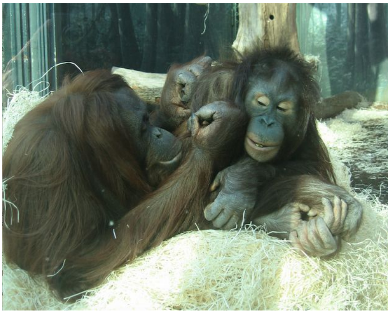
Figure 11. Orangs-outans, en captivité. Inféodés aux forêts tropicales d'Asie du Sud-Est, les orangs-outans voient leur habitat rétrécir comme peau de chagrin, grignoté par l'expansion des terres agricoles. Dotée d'un régime spécialisé (feuilles), de grands besoins énergétiques (donc spatiaux) et d'une faible fécondité, l'espèce subsiste dans quelques populations en déclin et en captivité.

le déclin éventuel de populations et espèces ' K ' généralistes, dépassées par l'ampleur et la vitesse des transformations de leurs habitats et conditions de vie (Voir le Focus De la construction de niche à la destruction d'écosystèmes ).