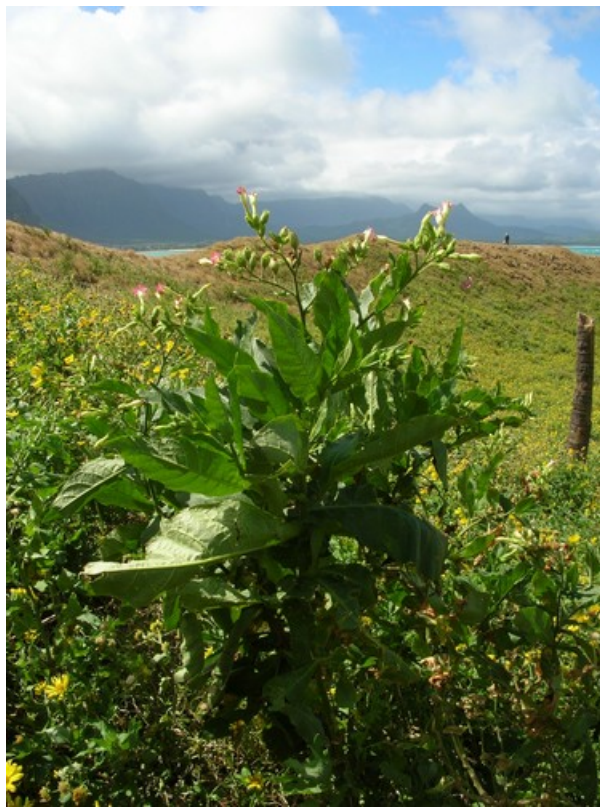
Figure 3. Plant de tabac. Lorsque ses feuilles sont attaquées par un prédateur, à l'instar de nombreux autres végétaux, la plante de tabac se défend en synthétisant des composés phénoliques toxiques pour les herbivores. En outre, tout comme l'Aulne, l'Armoise ou l'Erable à sucre, elle émet une phéromone d'alarme (composé volatil) qui induit la même synthèse chez les plantes de la même espèce situées à proximité.

Cependant, les organismes ne sont pas de simples automates, programmés pour s'alimenter, se défendre et se reproduire dans un environnement aux variations prévisibles et contrôlées : la plupart sont également capables de réagir à des variations inattendues de l'environnement par un comportement adéquat, révélant une certaine plasticité comportementale .