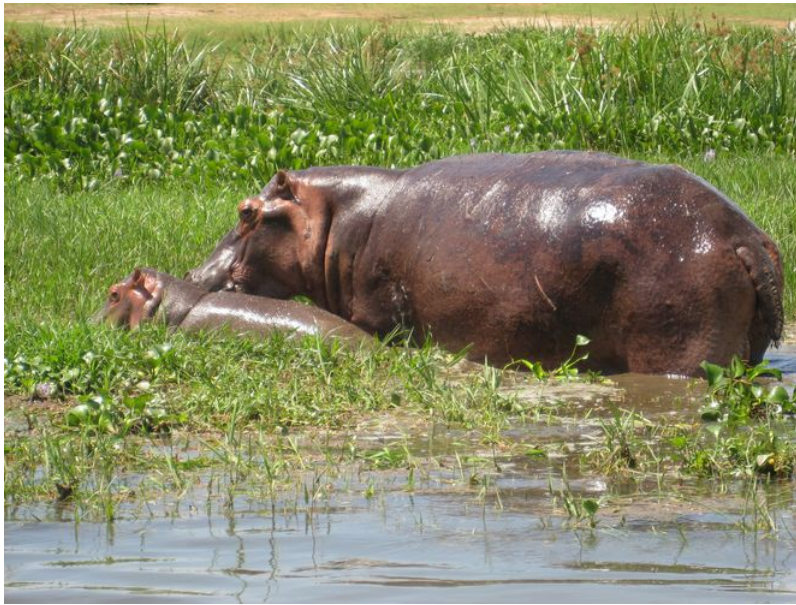
Figure 8. Femelle hippopotame et son petit. Comme la plupart des grands ongulés (antilopes, mouflons, chevaux, rhinocéros, ..), les femelles hippopotames amphibies atteignent leur maturité sexuelle entre 4 et 7 ans et donnent naissance à un seul petit après une longue gestation (8 mois) - au rythme d'un petit tous les deux ou trois ans dans leur cas.

La stratégie 'K', peu adaptée au bouleversement des habitats.