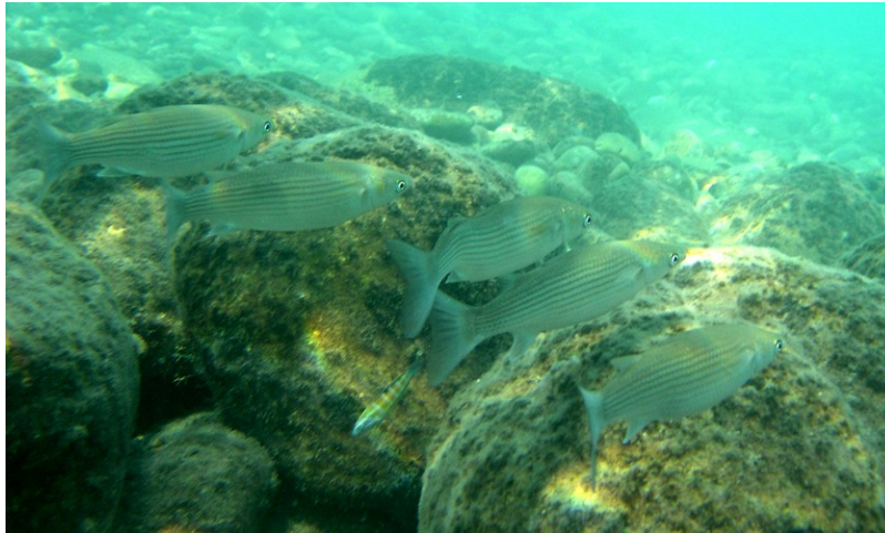
Figure 1. Peuplant estuaires, lagunes et littoraux méditerranéens, les mullets sauteurs ( Liza saliens ) tolèrent de larges fluctuations de salinité de l'eau.

Selon Hutchinson [2], toute espèce ou population peut être caractérisée par sa « niche écologique », définie comme la « place » occupée par cette espèce dans un écosystème et l'ensemble de ses exigences physiques, chimiques et biologiques à un instant donné. Produits de la sélection naturelle, ces exigences écologiques évoluent au fil des générations, avec la physiologie et le comportement des espèces. Ainsi la « largeur » de la niche écologique de chaque espèce est adaptée aux variations des conditions de vie habituellement rencontrées par les individus, dans le temps et dans l'espace (Lire Focus De la construction de niche à la destruction d'écosystèmes ).