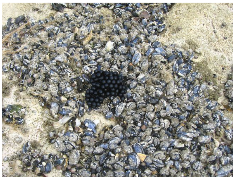
Figure 7. Estran. Comme la plupart des 'invertébrés' marins, les moules, bigorneaux, seiches et cirripèdes sont des espèces de type 'r', très fécondes.

Chez les végétaux, cette stratégie 'r' est celle de nombreuses plantes annuelles et graminées , qui dispersent en quantités pollens et graines sur de bonnes distances ( via le vent ou le transport animal) et colonisent rapidement les habitats ouverts avant d'être broutées, piétinées, brûlées, fanées ou remplacées par d'autres espèces plus compétitives et longévives.