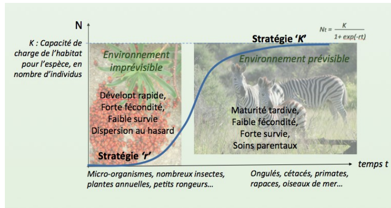
Figure 5. Les stratégies démographiques r et K résument les adaptations des espèces, soit à la colonisation d'habitats temporaires (partie gauche du schéma), soit à la compétition en habitats prévisibles et saturés (partie droite du schéma). Elles correspondent respectivement aux étapes initiales et au plateau de saturation de la relation logistique N_t = K / [1 + \exp(-rt)] , qui décrit la dynamique d'occupation d'un habitat par une population au cours du temps t . Avec N_t : nombre d'individus ; K : capacité de charge de l'habitat pour l'espèce considérée ; r : taux de croissance intrinsèque de la population. A gauche : larves de 'gendarmes' ( Pyrrhocoris apterus ) récemment écloses, avant dispersion. A droite : Zèbres de Burchell dans la savane, Zimbabwe.

Selon l'ampleur et la prévisibilité des changements environnementaux, étalés sur plusieurs générations, on peut schématiquement distinguer deux grandes stratégies démogénétiques (voir la Figure 5) :