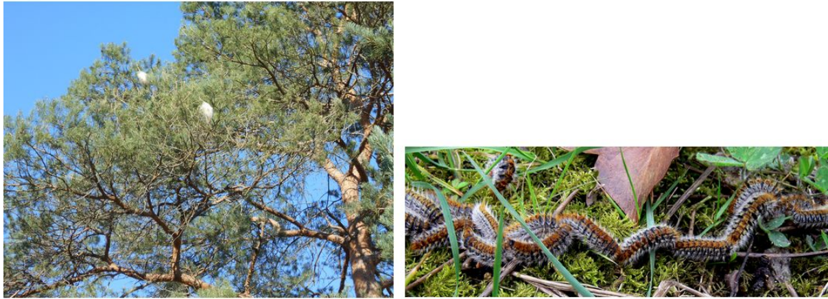
Figure 10. Processionnaires du Pin. À gauche, Nids de chenilles processionnaires dans un pin sylvestre. [Source : © Traumrune / Wikimedia Commons] ; À droite, Ligne de chenilles processionnaires dans la forêt. [Source : Lamiot, CC BY-SA 3.0, via Wikimedia Commons]. Dotées d'une grande fécondité (pour les papillons adultes) et d'un bon appétit pour les aiguilles de pin (pour les chenilles), les populations de processionnaires du pin ( Thaumetopoea pityocampa ) profitent du changement climatique pour accroître leur aire de répartition en altitude et vers le Nord.

le déplacement plus ou moins rapide d'espèces ' r ' et ' K ' vers des conditions de vie plus favorables, en réponse au réchauffement climatique – par exemple, déplacement de scolytes (coléoptères xylophages), tordeuses (chenilles phytophages) et autres insectes dits 'ravageurs des forêts', vers les pôles et en altitude.