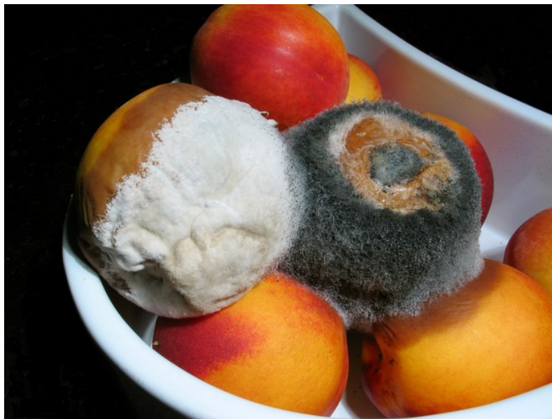
Figure 6. Colonisation de nectarines –riches en nutriments- par des champignons microscopiques dits 'moisissures'.

C'est la stratégie habituelle des microorganismes -tels que bactéries, protistes, champignons... et virus !- peuplant des habitats temporaires (hôtes animaux ou végétaux, habitats saisonniers, déchets organiques...), ainsi que des algues et champignons macroscopiques, aptes à coloniser rapidement tout nouvel habitat favorable.