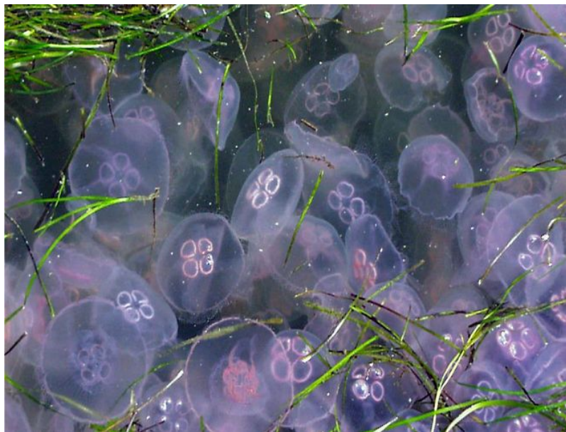
Figure 14. Pullulation de méduses communes ( Aurelia aurita ) sur une cote danoise.

Au fil du temps, les pressions sur les communautés et réseaux écologiques augmentent avec l'accaparement des terres et des « ressources » par les sociétés humaines. De fait, la conversion ou dégradation d'habitats riches en biodiversité (tels que forêts, marais, rivières et mers poissonneuses...) en habitats appauvris (champs cultivés, rivières polluées, mers « surpêchées »), de moindre capacité biotique, réduit d'au moins d'un quart [21] la quantité totale de ressources disponibles pour les espèces sauvages. Cette restriction implique non seulement une réduction de l'abondance et de la biomasse des communautés animales et végétales concernées [22], [23], mais aussi du nombre d'espèces [24]. Elle favorise ainsi un raccourcissement des réseaux trophiques [25], [26] avec un risque accru d'effondrement des écosystèmes (voir focus De la construction de niche à la destruction d'écosystèmes ) et de basculement vers un autre état stable défavorable à quantité d'espèces dont la nôtre [27], [28], [29].