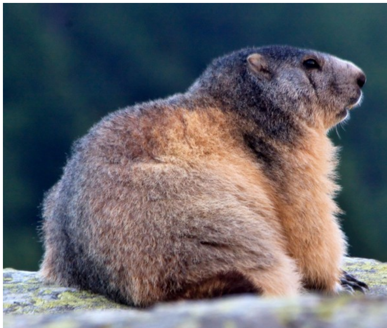
Figure 2. Les marmottes alpines (Marmota marmota) font d'amples réserves de graisses à la fin de l'été, avant de tapisser leur terrier d'herbes sèches et de s'y enfermer en famille pour y passer l'hiver.

Ils accompagnent en cela maintes espèces animales, notamment d'insectes et de vertébrés terrestres (mammifères, reptiles et amphibiens, mais pas d'oiseaux) qui se réfugient dans un abri pour y affronter l'hiver en état de torpeur (hibernation, léthargie hivernale, diapause...). Chez les oiseaux, organismes à sang chaud incapables de basculement hypothermique, certaines espèces telles que geais, sittelles et casse-noix font des réserves de graines dès la fin de l'été, qui les nourriront l'hiver, tandis que d'autres (insectivores notamment, comme les martinets et hirondelles) font provision de graisse et migrent vers des latitudes plus clémentes, avant de revenir nicher à la belle saison.