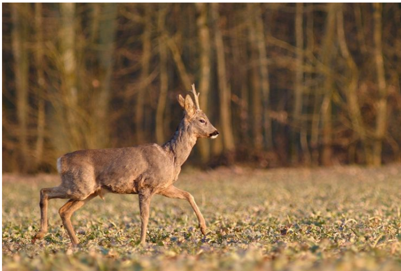
Figure 9. Chevreuil à l'orée d'un bois. Glanant sa nourriture en forêt comme dans les près et champs, profitant de l'absence ou rareté des loups et autres grands prédateurs, le chevreuil est une espèce généraliste en expansion en Europe.

Selon les caractéristiques biologiques et démographiques fondant le potentiel d'adaptation des espèces, on peut anticiper et vérifier sur le terrain :