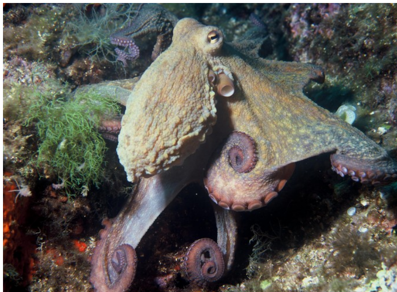
Figure 4. Les poulpes communs sont réputés pour leur propension à explorer et 'manipuler' de nouveaux objets, leur excellente mémoire visuelle et leurs capacités d'apprentissage.

Si elle existe chez les plantes, dénuées de véritables organes des sens, la plasticité comportementale est une propriété générale des animaux. Elle augmente avec leurs capacités d' apprentissage (capacités cognitives et pratiques), ainsi qu'avec leur socialité (complexité des groupes sociaux) et leur mobilité . Très observée chez certains invertébrés sociaux, comme l'Abeille domestique, ou non sociaux comme le Poulpe commun, elle culmine chez les mammifères et les oiseaux, dotés quant à eux de grandes capacités cognitives, de besoins énergétiques élevés et de systèmes sociaux souvent complexes [4].