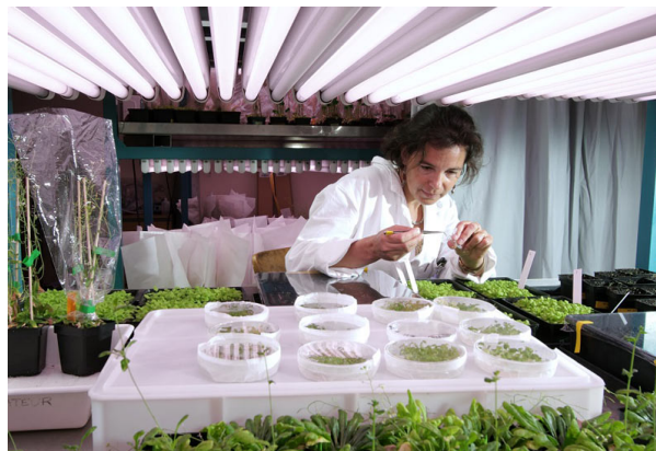
Figure 3. Expérimentation sur des plantules d' Arabidopsis thaliana . [source : © CEA-Grenoble.]

Un troisième niveau d'adaptation se situe entre les deux niveaux précédents. Comme le premier niveau, il est individuel et joue uniquement sur la régulation de l'expression des gènes, sans intervention sur leur structure. Mais ce troisième niveau fait intervenir une transmission héréditaire transitoire de ces régulations. Celle-ci permet aux descendants, sur quelques générations, de bénéficier de la réponse adaptative de leurs parents. On parle alors de mémoire épigénétique ou d'effet transgénérationnel (lire L'épigénétique, le génome et son environnement ). Ce type de phénomène est connu depuis longtemps, mais il était resté relativement exceptionnel. Les premiers cas connus concernaient surtout les paramécies, des eucaryotes unicellulaires. Depuis 2000, les exemples se sont multipliés et portent sur des caractères très variés. Ils ont souvent été observés en réponse à des stress environnementaux, mais aussi dans le cas de comportements maternels chez les rats [2].