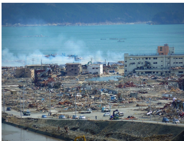
Figure 2. Dégâts du tsunami de 2011 au Japon

Le CRED, Centre de Recherches sur l'Épidémiologie des Désastres recense l'ensemble des événements naturels qui se produisent dans le monde et étudie leur évolution [1]. Selon les statistiques de 2015, entre 1994 et 2015 plus de 8 600 catastrophes naturelles ont fait plus de 1,5 millions de morts sur l'ensemble de la planète, soit près de 76 000 victimes par an directement liés aux phénomènes naturels. La figure 1, ci-contre, montre l'évolution du nombre de catastrophes naturelles et du nombre victimes au cours de ces 20 dernières années.