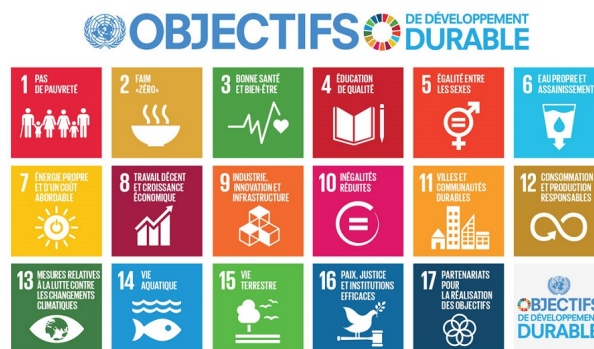
Figure 2. Les 17 Objectifs de développement durable (ODD) du Programme de développement durable à l'horizon 2030 de l'ONU.

Le développement durable est un champ de questionnements et de problématiques où se positionnent de nombreux travaux universitaires [8]. Cependant depuis quelques années on peut noter une certaine perte d'influence de ce concept aux niveaux nationaux et locaux ainsi que dans les revendications militantes qui s'en étaient réclamées durant les années 1990 et 2000. Au niveau onusien la référence reste cependant prééminente puisqu'elle a été réaffirmée en 2015 dans le cadre des « Objectifs de développement durable » (2015-2030) qui ont succédé aux « Objectifs du Millénaire » (2000-2015), qui étaient des objectifs cruciaux du développement dans un contexte Nord-Sud. A l'examen, les « Objectifs de développement durable », valables désormais pour tous les pays, ne sont pas particulièrement axés sur l'environnement, ce qui témoigne du glissement qui s'est opéré avec les années vers une conception plus large du développement.