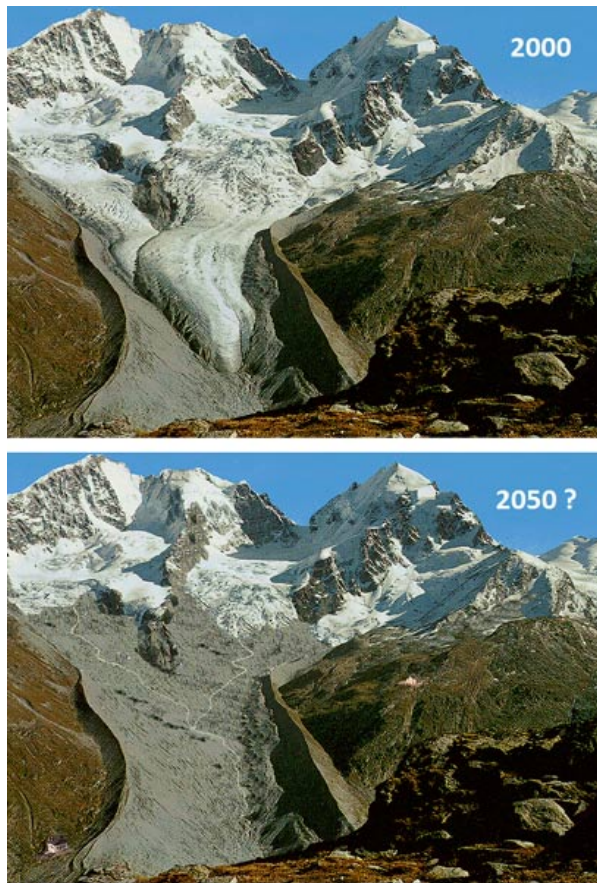
Figure 3. Vues du glacier de la Tschierva (Massif de la Bernina, sud-est de la Suisse) en 2000, et comme il apparaîtrait en 2050 selon les prévisions suite à un réchauffement de +3°C (Infographie et applications GIS: Max Maisch, Université de Zurich, Suisse).

De nombreuses études [6] [7] [8] [9] sur le futur comportement des glaciers alpins ont été publiées. Que ce soit à partir de modèles empiriques ou de modèles plus détaillés de bilan d'énergie, leurs conclusions convergent : elles indiquent que 50 à 90% des glaciers de montagne existants pourraient disparaître d'ici à 2100 selon l'ampleur du réchauffement climatique à venir [1]. Plus petit est le glacier, plus vite il réagira aux changements du climat. Pour la plupart des glaciers de montagne dans les régions tempérées du globe, les chercheurs établissent que l'altitude de la limite d'équilibre du glacier augmente fortement et linéairement avec la température. Inversement cette altitude décroît aussi linéairement lorsque les précipitations augmentent, alimentant mieux le glacier en altitude.