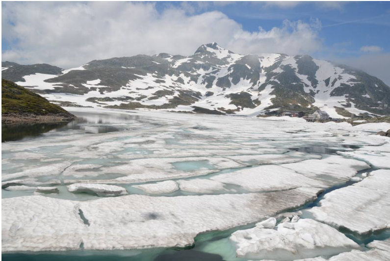
Figure 1. Débâcle estivale d'un lac au Col du Grimsel, alimentant le Rhône.

La neige est une composante essentielle du système hydrologique en montagne. Tout changement dans la quantité, la durée et le caractère saisonnier du manteau neigeux peut avoir des conséquences durables au niveau environnemental et économique [2]. Le moment de la fonte des neiges en montagne influence fortement le pic saisonnier des écoulements d'une rivière alpine . La fonte tardive qui perdure en haute montagne permet de maintenir un débit minimal même pendant les périodes chaudes et sèches de l'année.