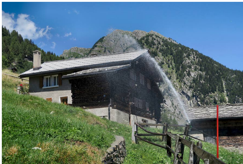
Figure 5. L'irrigation est utilisée traditionnellement dans le Valais central, l'une des régions les plus sèches de cette partie de l'Europe à cause de l'effet des barrières des Alpes valaisannes au sud et bernoises au nord

Quelle que soit la nature du changement des caractéristiques hydrologiques de nombreux cours d'eau ayant leur source dans les Alpes suisses, les changements des régimes climatiques en montagne se répercuteront dans les régions peuplées de basse altitude. Celles-ci dépendent des ressources en eau provenant des Alpes pour leurs usages domestiques, agricoles, énergétiques et industriels. A titre d'exemple selon diverses études précitées, le Rhône, à son exutoire alpin dans le Lac Léman, pourrait voir ses débits hivernaux passer de 100 m 3 /s dans le climat de référence (période 1961-1990) à 200 m 3 /s d'ici à 2100, mais diminuer de 350 à 200 m 3 /s en plein été (voir figure 4).