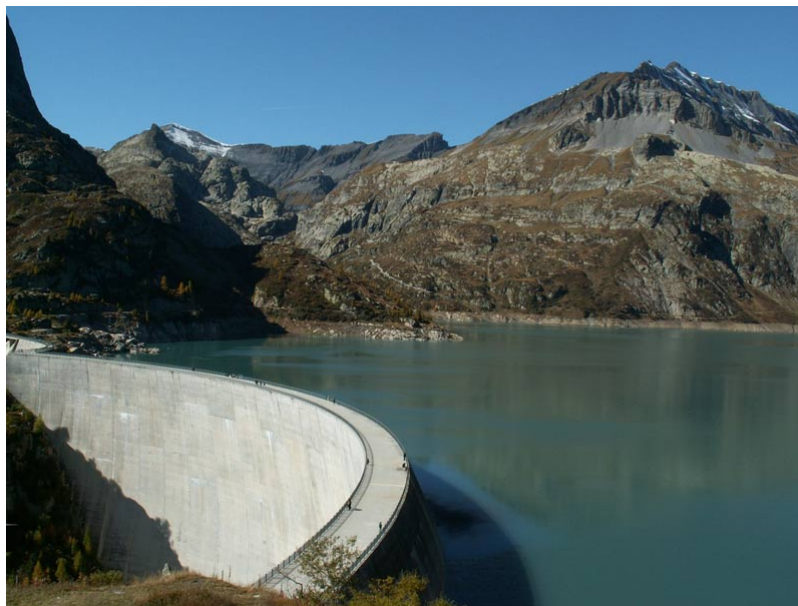
Figure 6: Le barrage d'Emosson, le deuxième plus grand barrage de Suisse par sa capacité, 227 millions de m 3.

Au-delà de ces secteurs clés, des changements dans l'occupation des sols ont généré depuis des décennies des changements dans l'offre et la demande en eau [22] par l'urbanisation croissante et de nouvelles affectations des terres réservées à l'agriculture. Ainsi, le rôle crucial de la forêt alpine, qui protège de l'érosion et contribue à la qualité des eaux de surface, pourrait également être menacé par une redistribution de la végétation alpine liée aux changements de régimes climatiques [23] [24]. Si le couvert végétal et forestier devait devenir plus épars, le ruissellement de surface s'accélérerait, augmentant alors le risque d'érosion et la charge en sédiments dans les cours d'eau. Cela provoquerait des risques supplémentaires pour les infrastructures, comme les installations hydroélectriques situées en aval.