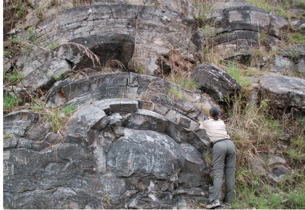
Figure 1. Exemple de marqueur morphologique prouvant l'existence d'une vie ancienne : des stromatolithes de belle taille (ici en Afrique du Sud) datant d'environ -3 milliards d'années.