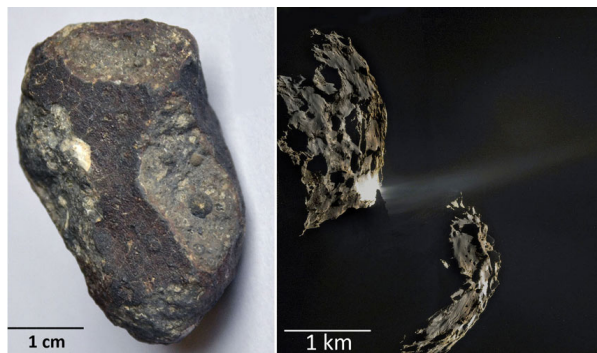
Figure 2. Comète et météorite. A gauche, un échantillon de chondrite carbonée. De telles météorites contiennent jusqu'à 5% de carbone, dont 60 ppm d'acides aminés. A droite, image de la comète 67P-CG (dite Churyumov-Gerasimenko, ou Tchury) photographiée le 26 septembre 2014 par la sonde européenne Rosetta. Les analyses (encore préliminaires) montrent que cette comète est riche en molécules organiques.

L'origine extraterrestre. Comètes et météorites constituent la deuxième source possible de l'origine des molécules de la vie (Figure 2). On sait depuis 1864 avec la chute de la météorite d'Orgueil (Tarn et Garonne) que certaines météorites (les chondrites carbonées) contiennent ces fameuses « briques élémentaires de la vie ». On a prouvé dès les années 1960 que ces molécules organiques étaient intrinsèques à la météorite et ne provenaient pas d'une pollution terrestre, contrairement ce qu'on évoquait (voire invoquait) dès la chute de la météorite d'Orgueil. Une tonne de cette classe de météorite contient 60 grammes d'acides aminés, soit la masse d'un œuf de poule, et 1,3 grammes de bases azotées.