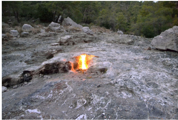
Figure 3. Dégagement enflammé d'un mélange de méthane, éthane, propane et dihydrogène sortant d'un sol de serpentine dans le sud de la Turquie. Ce site, nommé « la Chimère » prouve la réalité des réactions d'organosynthèse type Fischer-Tropsch, puisqu'elles ont lieu de nos jours dans le sous-sol turc.

Il peut donc y avoir synthèse d' H_2 dès que de l'eau (eau de mer, eau souterraine ...) est en contact avec des roches chaudes riches en olivine comme les péridotites (Figure 3). Cette réaction produit de la magnétite ( Fe_3O_4 ) et de la serpentine. Or il se trouve que la magnétite est un catalyseur favorisant les réactions de type Fischer-Tropsch. De plus la brucite ( Mg[OH]_2 ) entretient un milieu basique favorisant les réactions de type Strecker. Et il se trouve que la serpentine est un très bon catalyseur pour la polymérisation des monomères organiques.