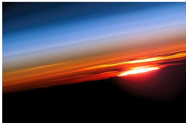
Figure 1. Un lever de soleil vu depuis la station spatiale internationale. L'homosphère se distingue par la couche basse, rougeâtre au soleil levant, et la couche bleue, correspondant à la stratosphère.

Quelles sont les caractéristiques physiques de cette couche atmosphérique ? La pression et la masse volumique y diminuent en fonction de l'altitude suivant une loi exponentielle (lire L'atmosphère et l'enveloppe gazeuse de la Terre ). Lorsqu'on s'élève, la température décroît de façon linéaire dans la troposphère, de 6 à 7 degrés par kilomètre. Cette dernière valeur dépend grandement du taux d'humidité relative de l'air.