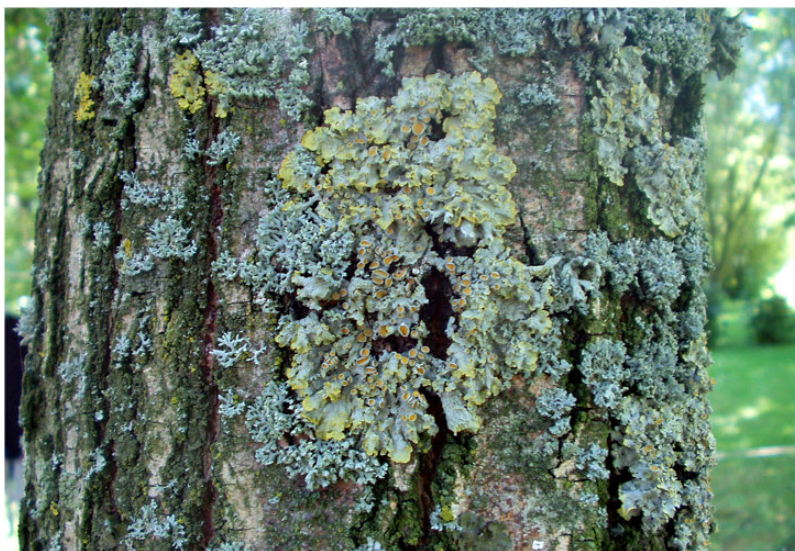
Figure 1. Exemples de lichens épiphytes utilisés pour la biosurveillance de la qualité globale de l'air. On remarque sur cette photo notamment Xanthoria parietina (lichen jaune), Physcia adscendens et Physcia tenella (lichens bleus).

Les premières observations « modernes » ont porté sur l'évolution des communautés lichéniques. Dans les années 1970 -1980, les polluants atmosphériques majoritaires en Europe de l'Ouest étaient le dioxyde de soufre et les poussières en suspension (SO 2 et PS), principalement d'origine industrielle. A cette époque, différents auteurs tels qu'Hawksworth et Rose [4] en Angleterre ou Van Haluwyn et Lerond [5] en France ont étudié l'impact de ces polluants sur les communautés lichéniques épiphytes (se développant sur les troncs d'arbres, Figure 1). Ces auteurs ont observé un impact clair de la pollution atmosphérique sur la composition spécifique des communautés lichéniques (diminution de la richesse spécifique mais également modification de la composition des populations de lichens observées sur les troncs avec une augmentation de la pollution), à l'instar de Nylander précédemment cité. Ils ont élaboré différentes méthodes d'appréciation des effets des polluants atmosphériques directement sur le terrain, par l'observation des espèces de lichens. Ces méthodes étaient basées notamment sur l'observation de la présence, de l'abondance d'espèces plus ou moins sensibles aux polluants. La situation de la pollution atmosphérique a progressivement évolué et s'est complexifiée (diminution du SO 2 , augmentation des concentrations d'azote, d'ozone, de composés organiques...).