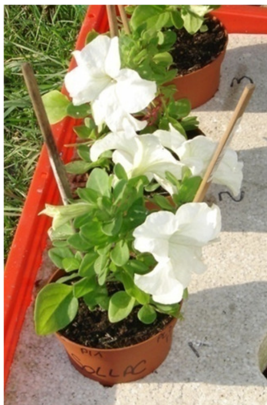
Figure 4. Plants de Pétunia utilisés pour la biosurveillance des composés organiques volatils..

disposons de plusieurs modèles, le plus « célèbre » étant le tabac Bel W3 dont l'utilisation en biosurveillance est normalisée (norme AFNOR X95-900) [7]. L'ozone provoque chez cette espèce des nécroses foliaires blanches, ivoires (Figure 3). Lors de l'exposition, la formation de nécroses chez les plants de variété « Bel W3 » est comparée celle avec les plants de variété « Bel B » plus résistants, afin d'évaluer les dégâts dus à l'ozone et de confirmer qu'il ne s'agit pas de dégâts provoqués par des organismes phytopathogènes.