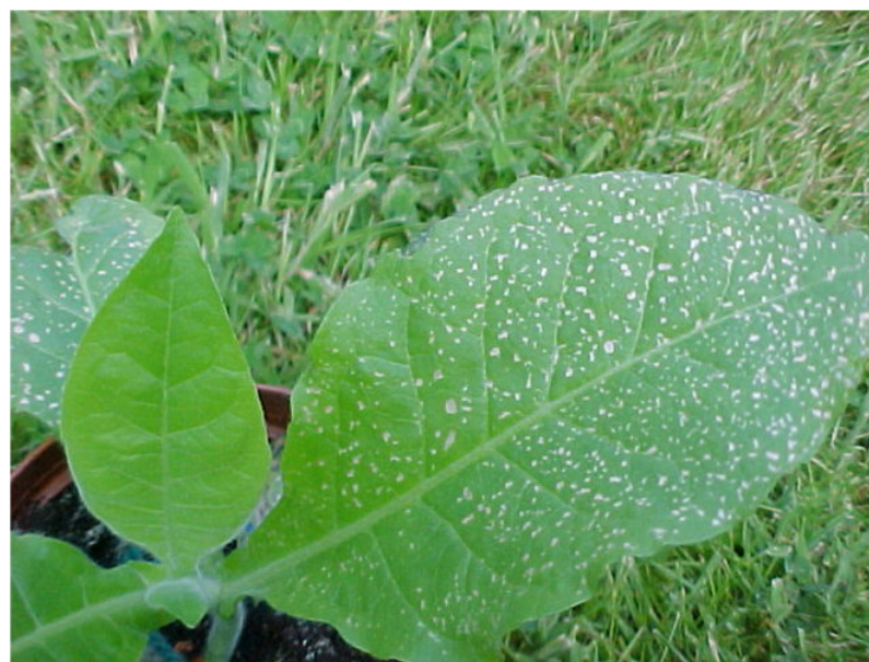
Figure 3. Nécroses foliaires provoquées par l'ozone sur les feuilles de tabac [Source : Comité Hauts de France de l'A.P.P.A., © APPA].

Certains polluants vont provoquer sur les végétaux des symptômes caractéristiques, visibles (lire l'article Quel est l'impact des polluants de l'air sur la végétation ? ). L'exemple le plus significatif est celui de l'ozone qui provoque des nécroses foliaires. Nous