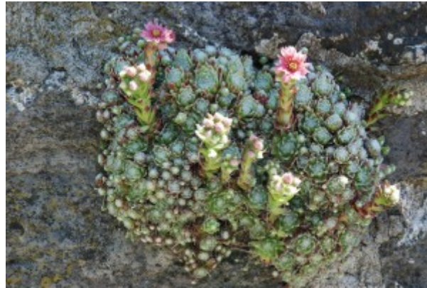
Figure 1. Joubarbe aranéuse ( Sempervivum arachnoideum L.). [Source Photo Jacques Joyard].

Richard Bligny , Ancien Directeur de Recherche CNRS, laboratoire de Physiologie Cellulaire et Végétale, Université Grenoble Alpes