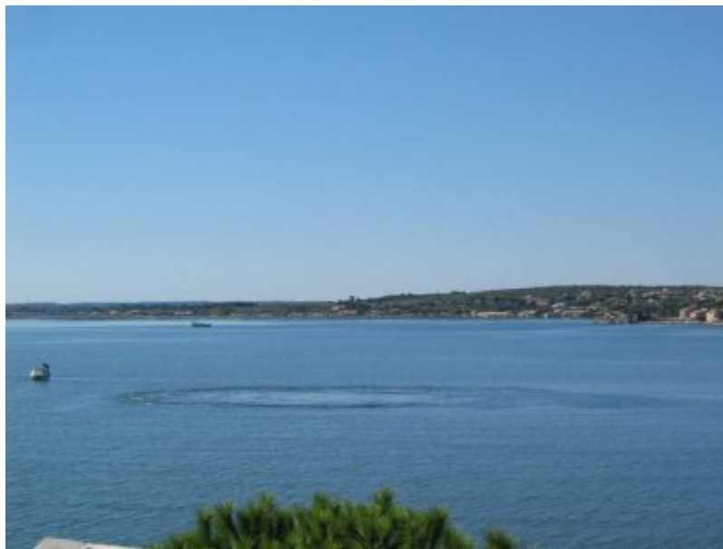
Figure 2. Source karstique sous-marine de la Vise, étang de Thau, Balaruc-les-Bains (Hérault).

Ces argiles marines isolent les formations aquifères en les protégeant de l'intrusion d'eau marine. Mais elles n'existent pas partout, soit par absence de dépôt, soit par érosion ; les aquifères, en particulier karstiques, se déversent alors directement en mer. De ce fait, les phénomènes karstiques superficiels développés au Messinien, puis submergés par la transgression marine du Zancléen, permettent les échanges entre l'eau de mer et l'eau douce souterraine. Cette situation très particulière est à l'origine des sources sous-marines et saumâtres connues le long de toutes les côtes méditerranéennes où se trouvent plus de 90 % de toutes celles connues au monde [4]. Celles de Chekka, sur la côte septentrionale du Liban, sont souvent considérées parmi les plus importantes au monde par leur débit estimé à plusieurs dizaines m 3 /s en crue [5]. En France, la source de Port Miou, près de Marseille, débite quelques m 3 /s d'eau saumâtre [6].