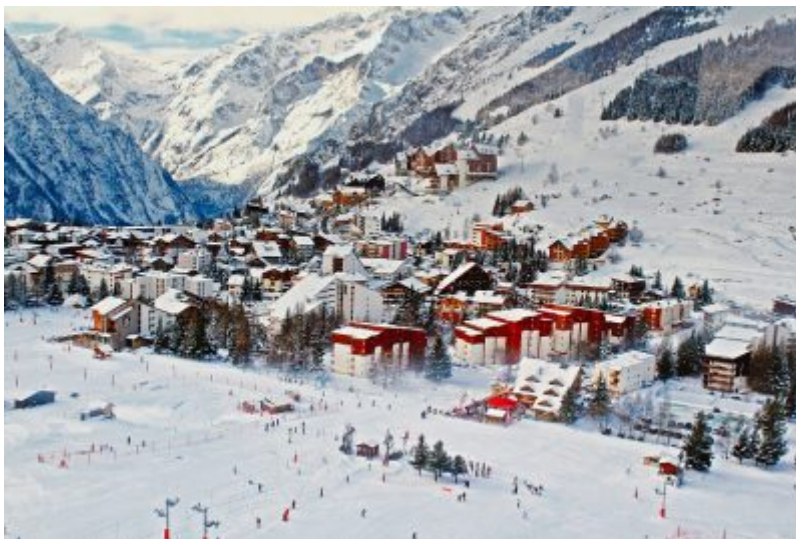
Figure 2. Remontées mécaniques, pistes et immobilier touristique.

Leur création relève soit des documents d'urbanisme locaux (UTNS par les schémas de cohérence territoriale, UTNL par les plans locaux d'urbanisme), soit, en leur absence, de l'État (un arrêté du préfet). Une fois autorisées ou planifiées, les communes ou les intercommunalités peuvent délivrer ou demander la délivrance à l'Etat des autorisations requises au titre de diverses législations parallèles : déboiser, construire ou aménager, installer les remontées mécaniques, aménager les pistes ou prélever de l'eau [3] .