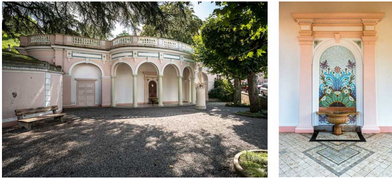
Figure 1. La buvette Cachat, à Evian-les-Bains, délivre en continu l'eau minérale naturelle Evian au public

En France, l'intérêt pour les eaux thermales a perduré au Moyen-Âge. Toutes les sources thermales ont même été transformées en propriété de l'État en 1549 avec les lettres patentes signées par Henri II [1]. En 1605, Henri IV instaure les premiers contrôles de l'État sur les eaux thermales et médicinales du royaume en créant la Surintendance des eaux minérales. Cette propriété de l'État étant peu respectée par de nombreux propriétaires fonciers qui exploitent, à titre privé, les eaux jaillissant sur leurs terres, Louis XV, tout en confirmant ce droit en 1772, reconnaît néanmoins celui des propriétaires des terrains sur lesquels jaillissent des sources. Ce problème est définitivement réglé en 1781 par un arrêt du Conseil d'Etat qui distingue d'une part les sources appartenant à l'État et, d'autre part, celles présentes sur les propriétés des particuliers que ces derniers peuvent exploiter après autorisation de la Société royale de médecine et sous réserve du respect de la réglementation en vigueur.