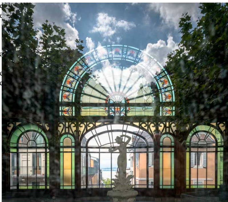
Figure 3. Etablissement thermal à Evian-les-Bains

De par la réglementation, l'EMN peut être utilisée conditionnée (en bouteille), distribuée en buvette publique (figure 1) ou utilisée à des fins thérapeutiques dans un établissement thermal (figure 3).