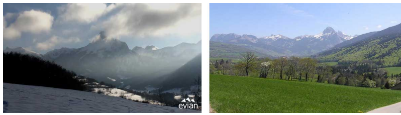
Figure 6. Aperçus de l'impluvium de l'EMN evian

A Evian par exemple [10], le bassin versant a une superficie d'environ 35 km 2 (figure 6). On évalue que 50 % des précipitations qui y tombent repartent vers l'atmosphère sous forme de vapeur d'eau du fait de l'évaporation et surtout de l'évapotranspiration due au métabolisme des plantes. Environ 35 % ruissellent en surface ou alimentent des nappes d'eau souterraine de faible profondeur, non minérales. Ainsi, seuls 15 % des eaux de pluie rechargent l'aquifère minéral.