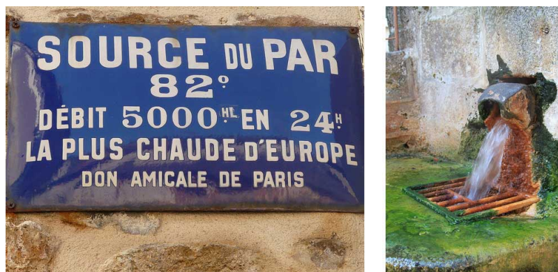
Figure 5. La source thermale du Par, à Chaudes-Aigues (Cantal), 82°C

Dans l'exemple ci-dessus de la source Badoit, la remontée des eaux profondes se fait très lentement. L'eau minérale naturelle a donc le temps de se refroidir progressivement au cours de celle-ci ; en surface, elle ne présente donc pas une température significativement plus élevée que celle des autres sources, de surface elles, du secteur. Rappelons que la température augmente, en moyenne, de 3 °C par 100 m lorsque l'on s'enfonce dans le sous-sol.