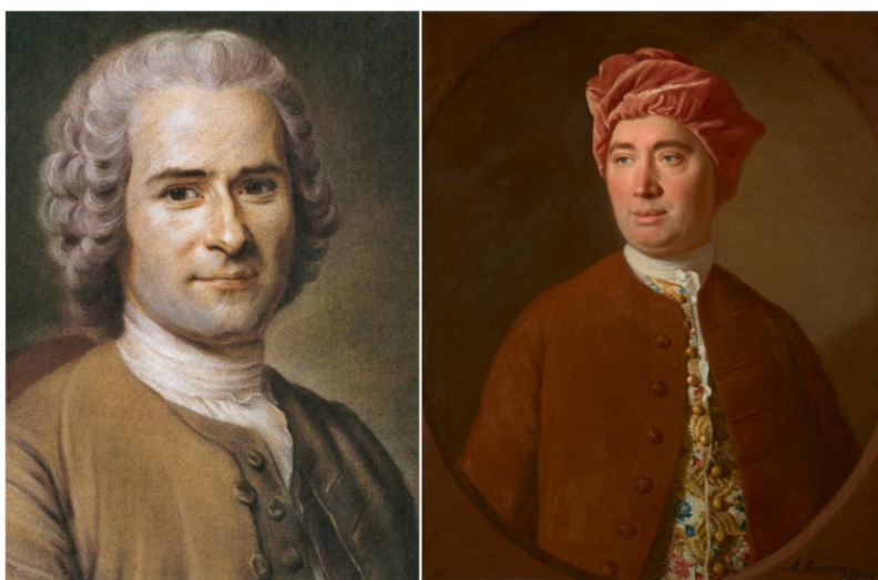
Figure 2. Portraits : à gauche, Jean-Jacques Rousseau (1712-1778), à droite, David Hume (1711-1776).

Ainsi, la « nature » est essentiellement demeuré un terme « vulgaire » dans les langues européennes, et n'a presque jamais fait l'objet d'une théorisation académique avancée, mis à part dans l'expression « nature humaine », qui eut son heure de gloire au XVIIIe siècle sous l'impulsion de David Hume ou Jean-Jacques Rousseau [1] (Figure 2).