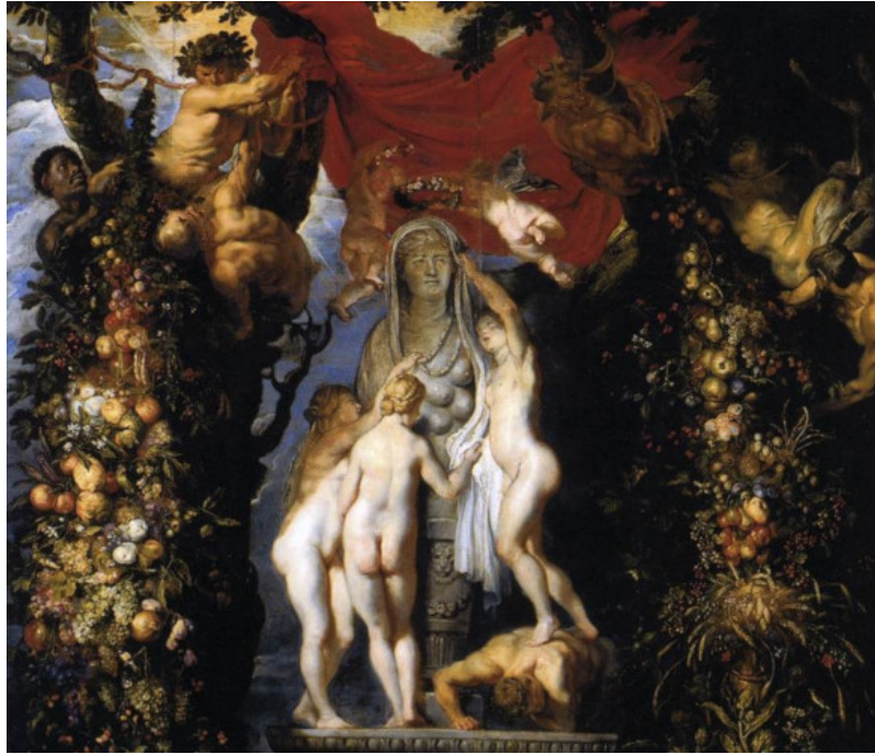
Figure 4. La nature ornant les trois grâces (partie haute). Tableau de Rubens et de Bruegel l'ancien. La statue au centre représente la « Terre Mère », figure maternelle d'Isis traditionnellement représentée avec de nombreux seins sur la poitrine. [Source : Peter Paul Rubens, Public domain, via Wikimedia Commons]

Ce n'est qu'à la Renaissance que la nature fait son grand retour dans le paysage intellectuel européen, suite à la redécouverte des textes antiques, mais sans réelle théorisation de son sens : la nature est alors vue soit comme l'ensemble de la création (incluant l'Homme ou pas), l'ensemble des forces physiques qui règlent le monde (« lois naturelles »), ou même une sorte de puissance abstraite du réel, parfois allégorisée en « Nature » avec majuscule, sorte d'émissaire terrestre de la volonté divine, voire de pendant féminin et bienveillant du Père tout-puissant (la nature était déjà allégorisée à la fin de l'Antiquité sous la figure maternelle d'Isis, qui sera plus tard laïcisée dans l'idée de « mère Nature » [5]) (Figure 4). Le fait que Platon, méta-physicien par excellence, ne semble pas s'être intéressé à ce concept trop basement terrestre, alors que les philosophes l'érigèrent progressivement pendant l'âge classique en arbitre en chef de ce qui est ou n'est pas un concept philosophique, a sans doute participé par la suite à le faire négliger par l'essentiel de la tradition académique européenne, et ce jusqu'à nos jours.